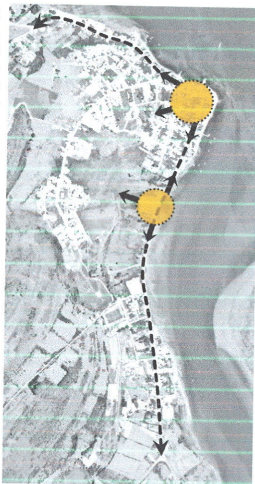
Imagen: Opción de Desarrollo N°3.

En el proceso de identificación de impactos y efectos resultó clave el trabajo desarrollado conjuntamente con profesionales municipales, profesionales de los distintos Órganos de la Administración del Estado, y vecinos de