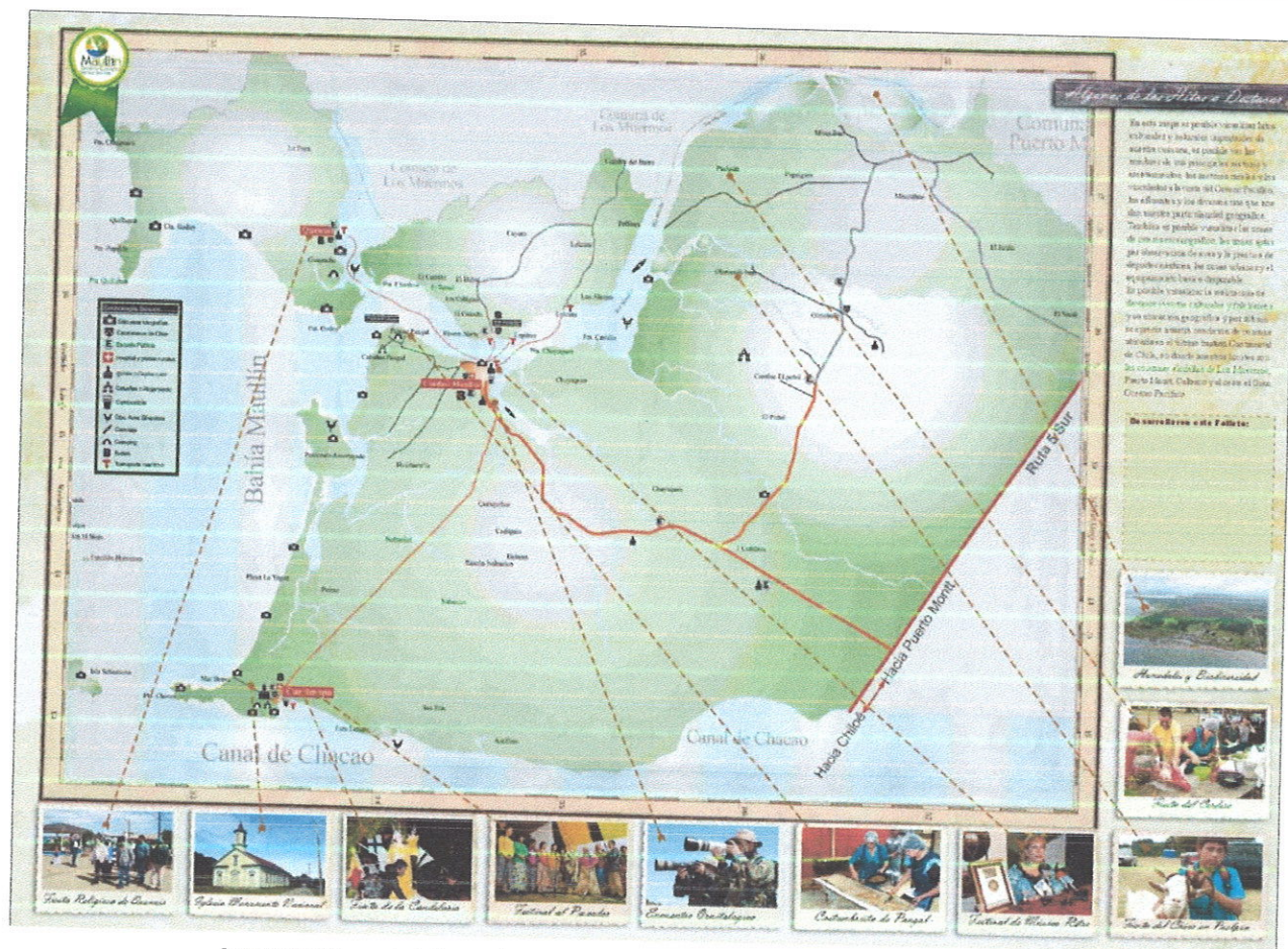
Imagen: Mapa de hitos culturales y naturales de Maullín.