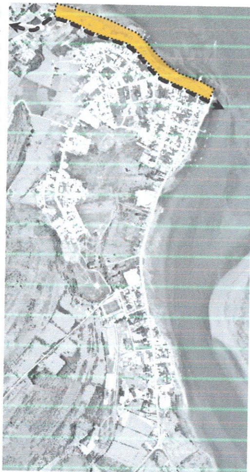
Imagen: Opción de Desarrollo N°2.